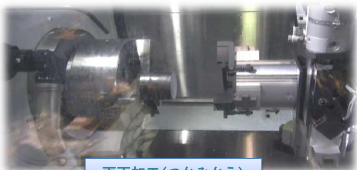
両面加工(つかみかえ)